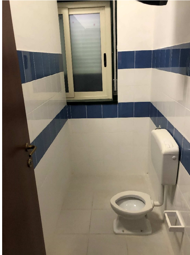
Figura 25 – Ripresa fotografica del Wc bimbi