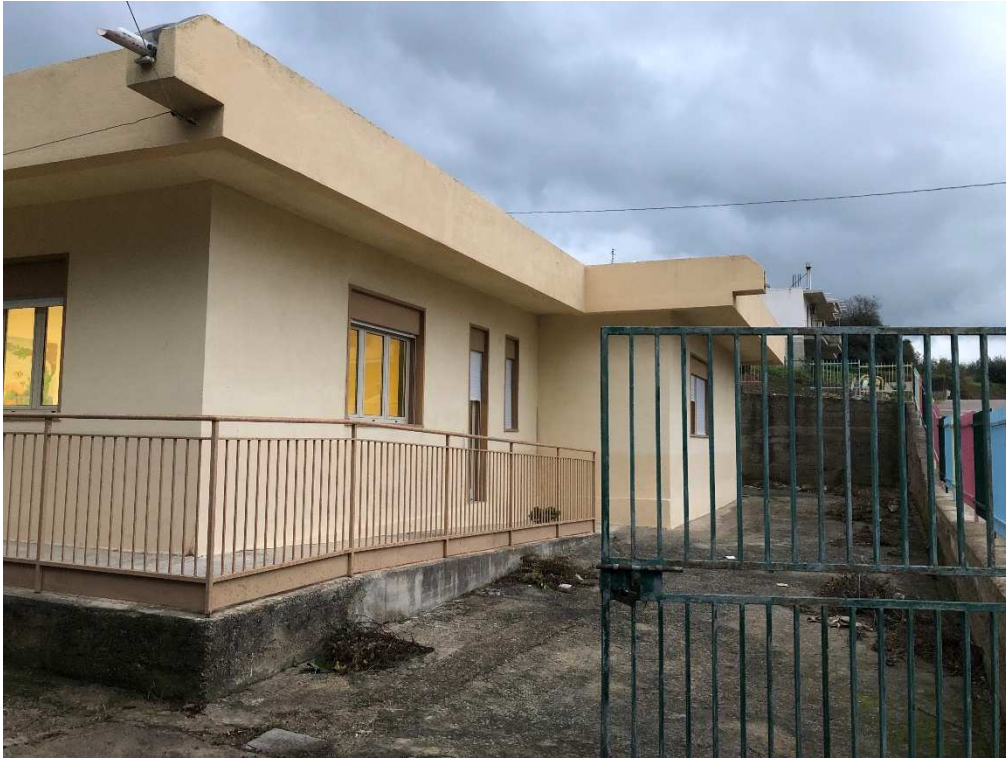
Figura 3 – Ripresa fotografica del Prospetto SO della scuola materna