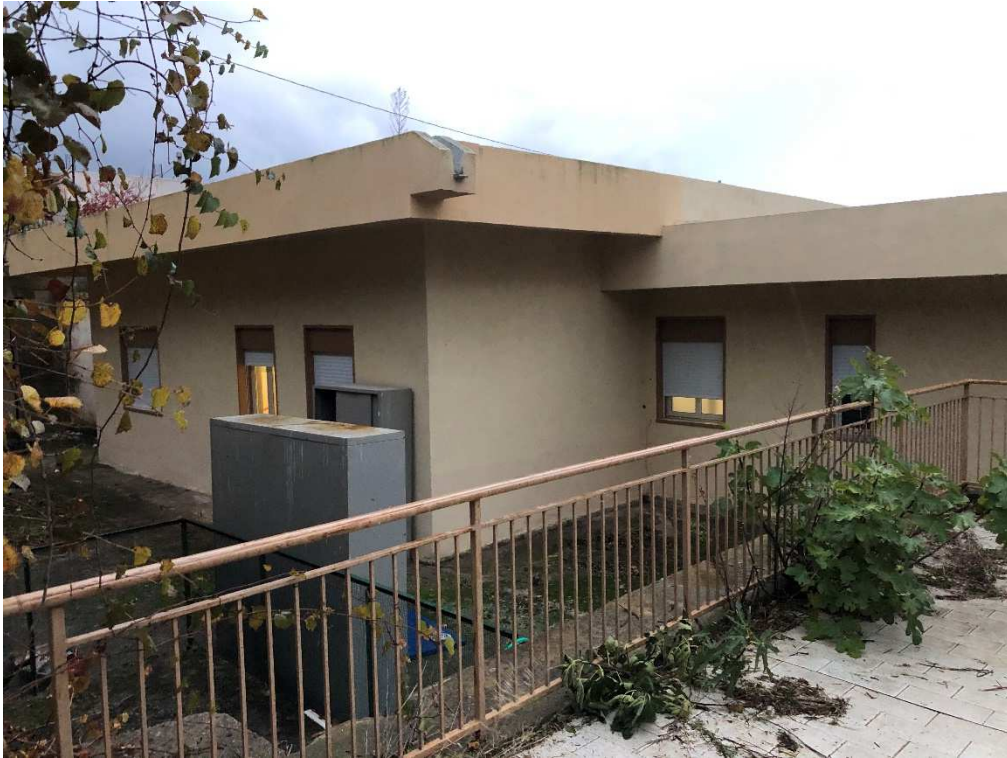
Figura 9 – Ripresa fotografica di porzione del prospetto NE