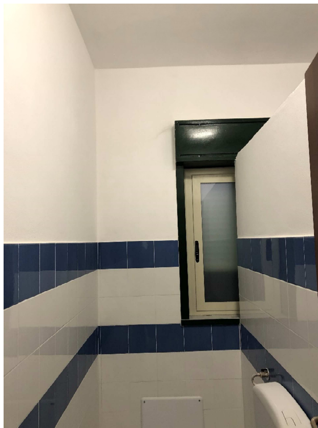
Figura 26 – Ripresa fotografica del Wc-alunni