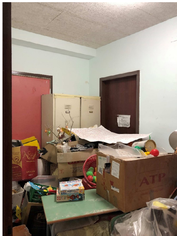
Figura 14 – Ripresa fotografica ripostiglio