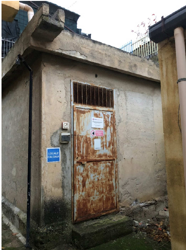
Figura 8 – Ripresa fotografica della centrale termica