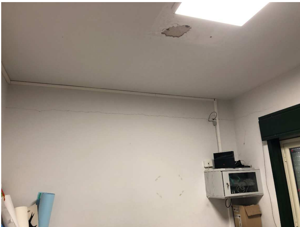
Figura 28 – Ripresa fotografica ripostiglio