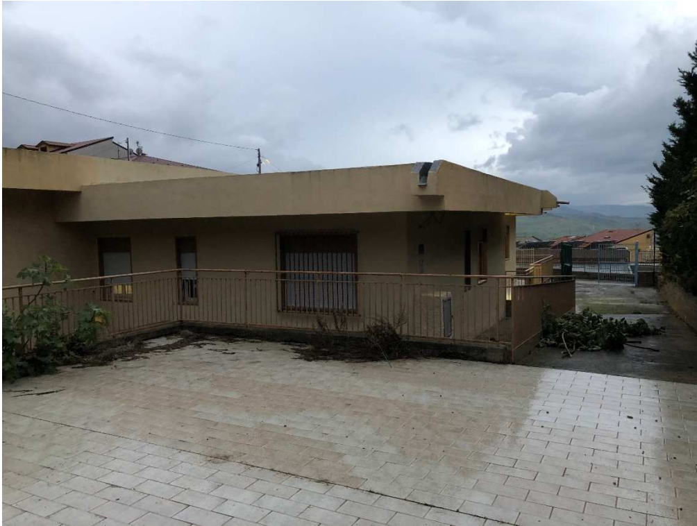
Figura 11 – Ripresa fotografica di porzione del prospetto NE e del prospetto NO, con vista su cancello d'ingresso