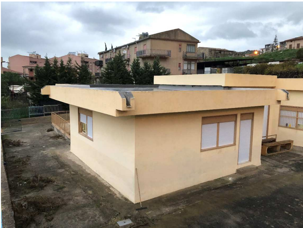
Figura 4 – Ripresa fotografica dalla via Placido di Blasi del Prospetto SO e SE della scuola materna