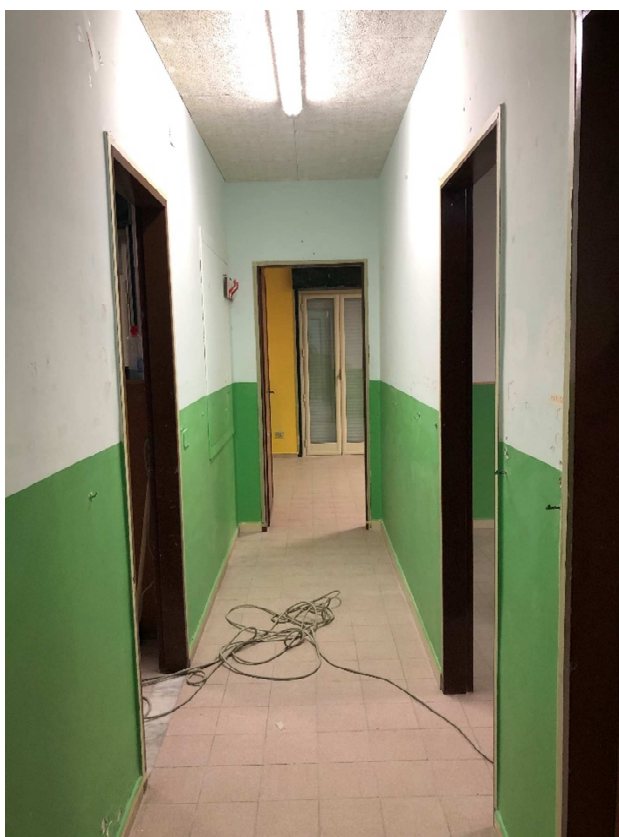
Figura 16 – Ripresa fotografica disimpegno 1