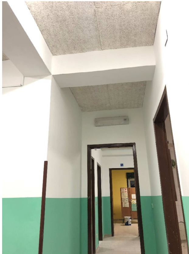
Figura 23 – Ripresa fotografica del disimpegno 2