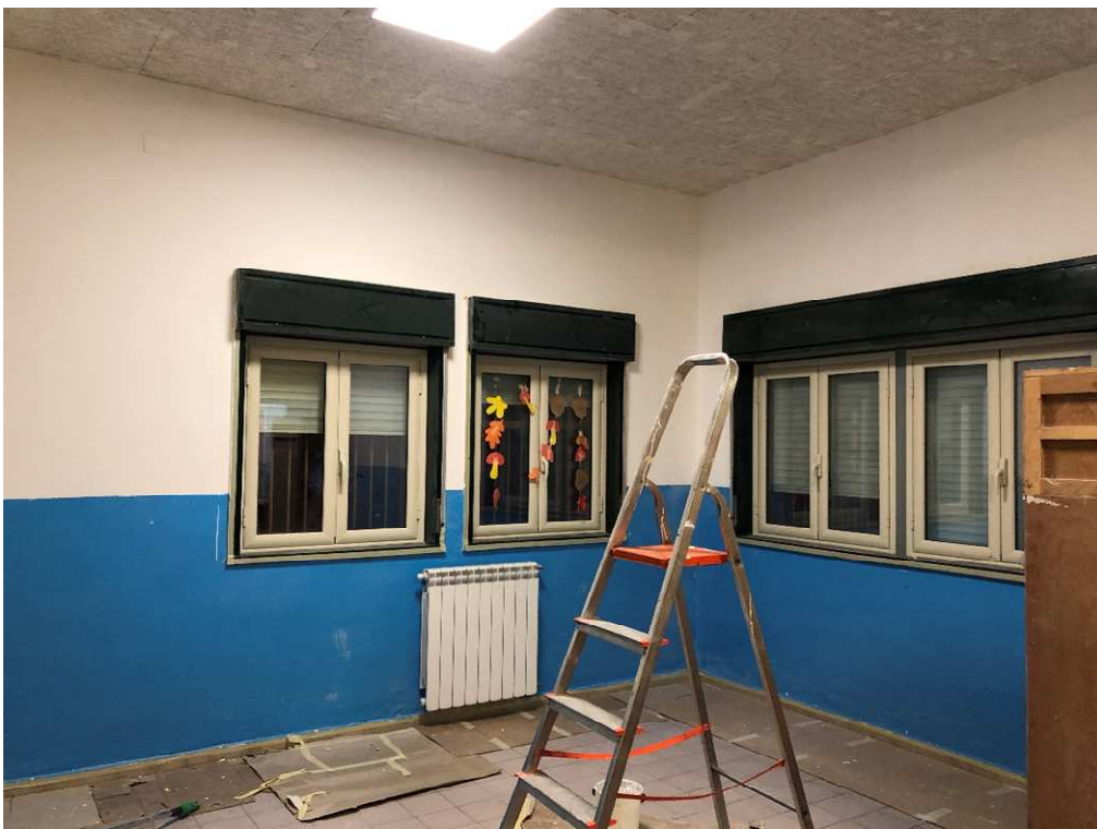
Figura 20 – Ripresa fotografica aula 5