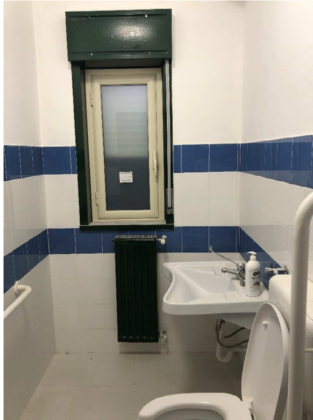
Figura 27 – Ripresa fotografica del WC-H