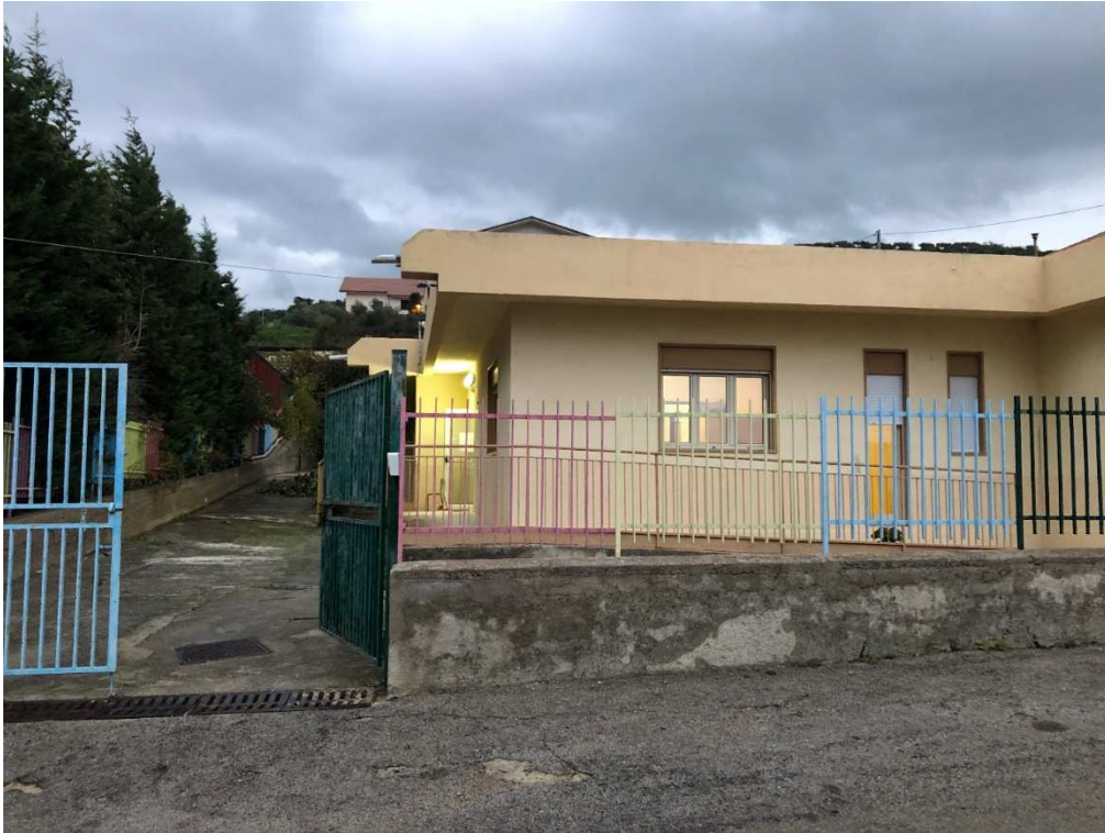
Figura 1 – Ripresa fotografica dell'ingresso all'area dalla via J. Kennedy