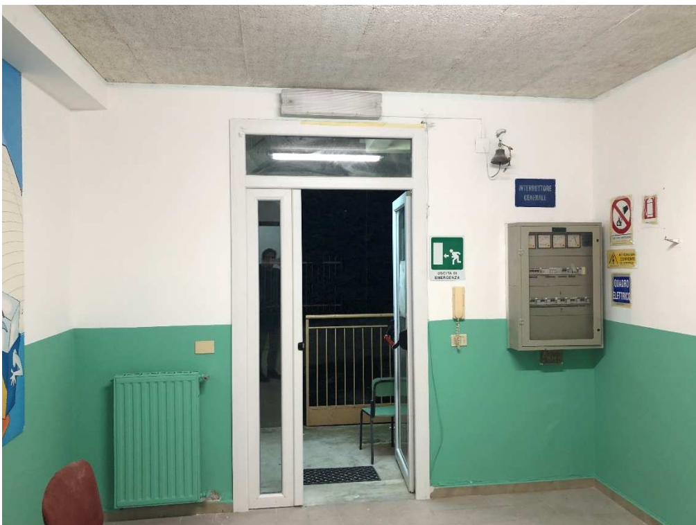
Figura 12 – Ripresa fotografica dell'ingresso