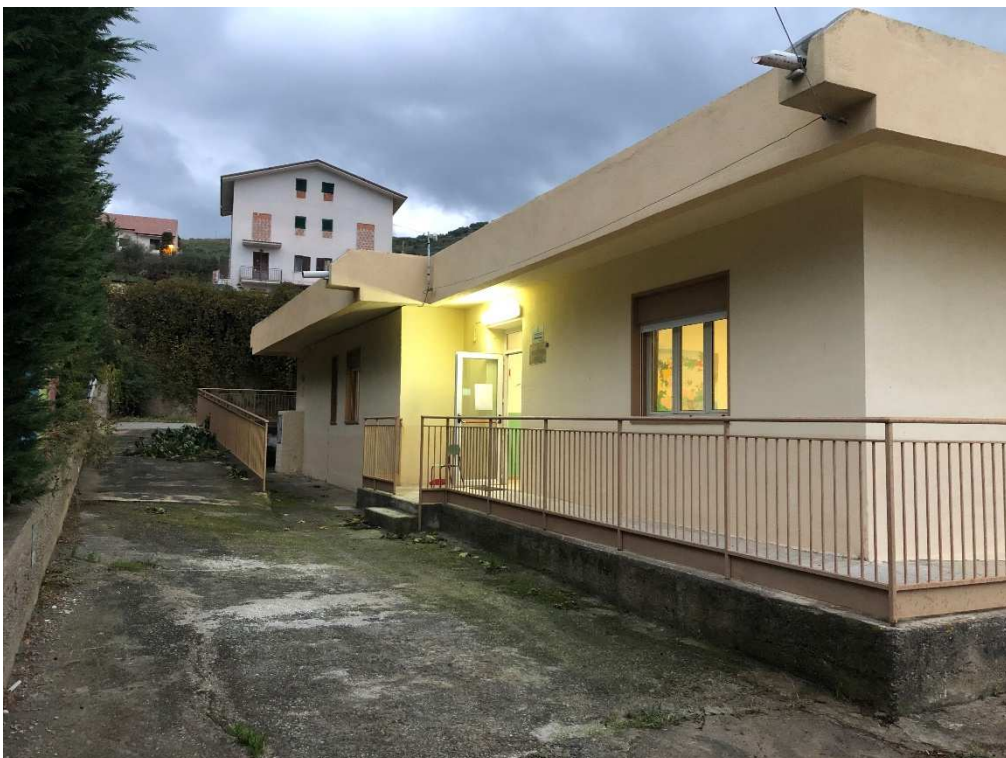
Figura 2 – Ripresa fotografica del Prospetto NO con ingresso principale della scuola materna