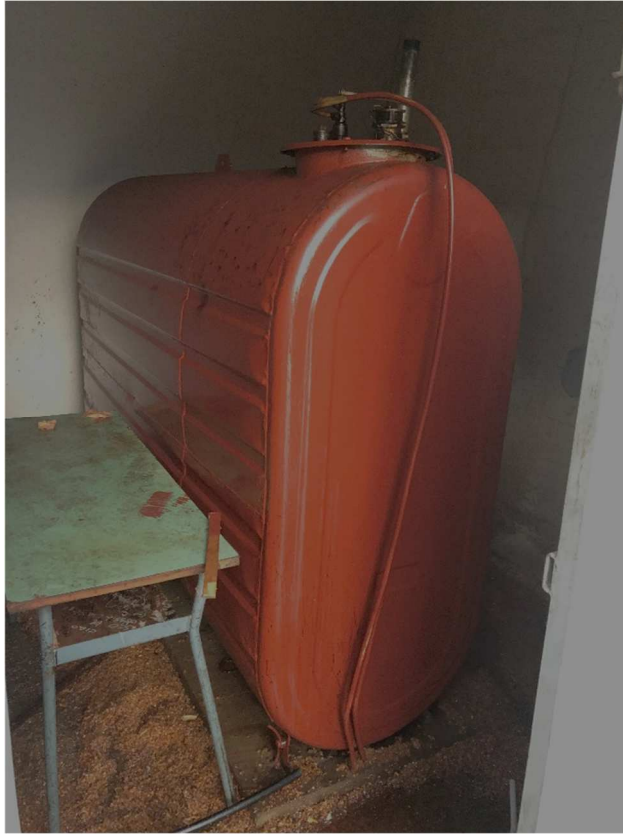
Figura 31 – Ripresa fotografica interno deposito gasolio