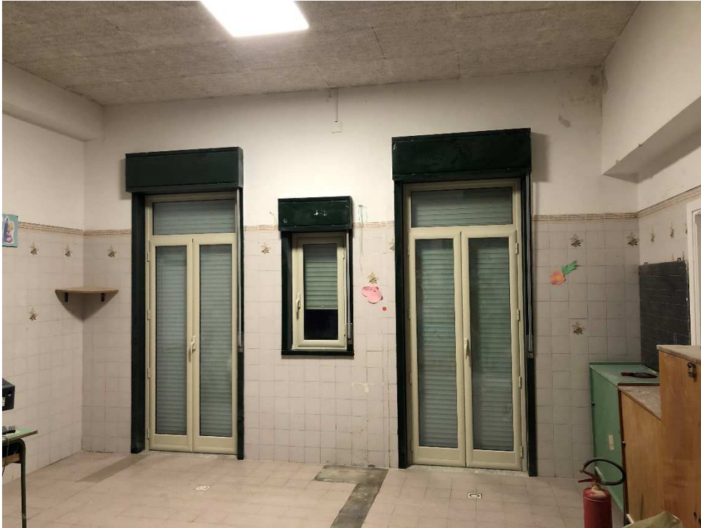
Figura 19 – Ripresa fotografica aula 4