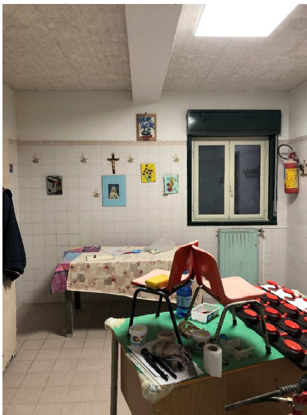
Figura 15 – Ripresa fotografica all'interno della sala professori