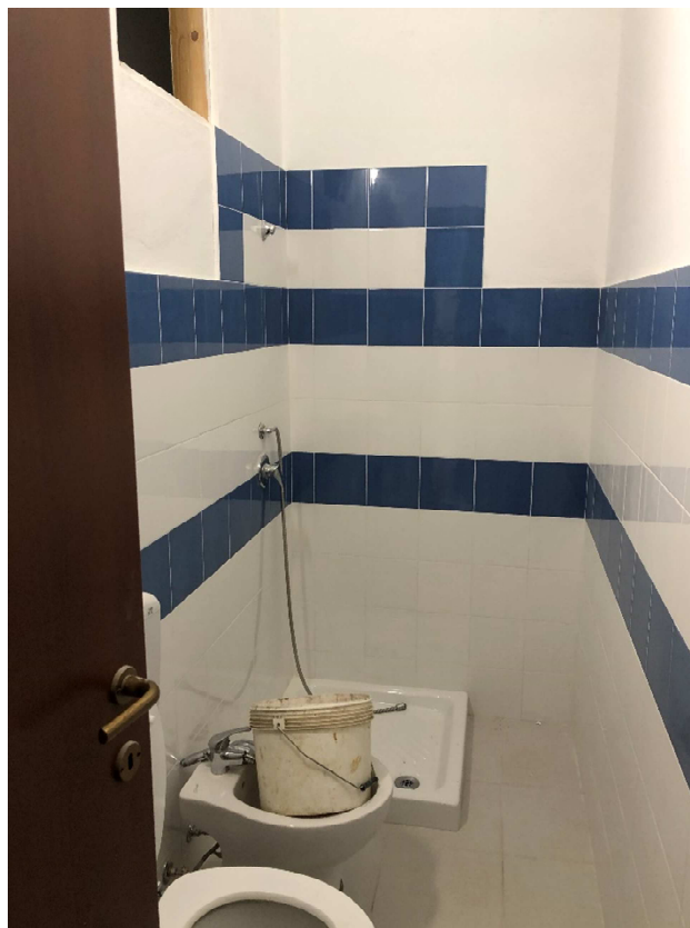
Figura 24 – Ripresa fotografica del Wc