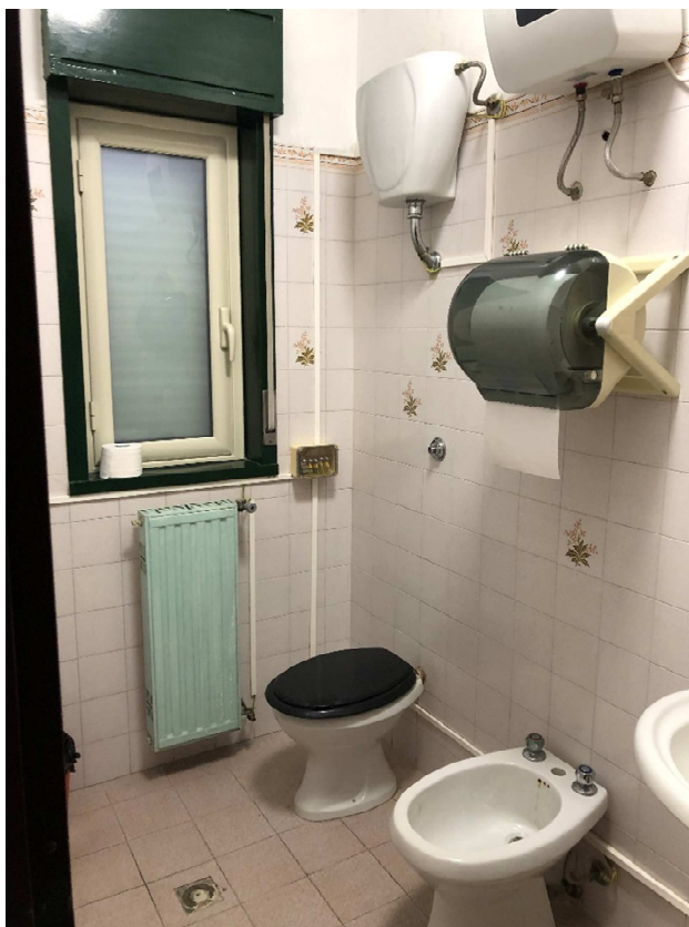
Figura 29 – Ripresa fotografica Wc docenti