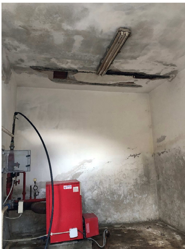
Figura 30 – Ripresa fotografica interno centrale termica