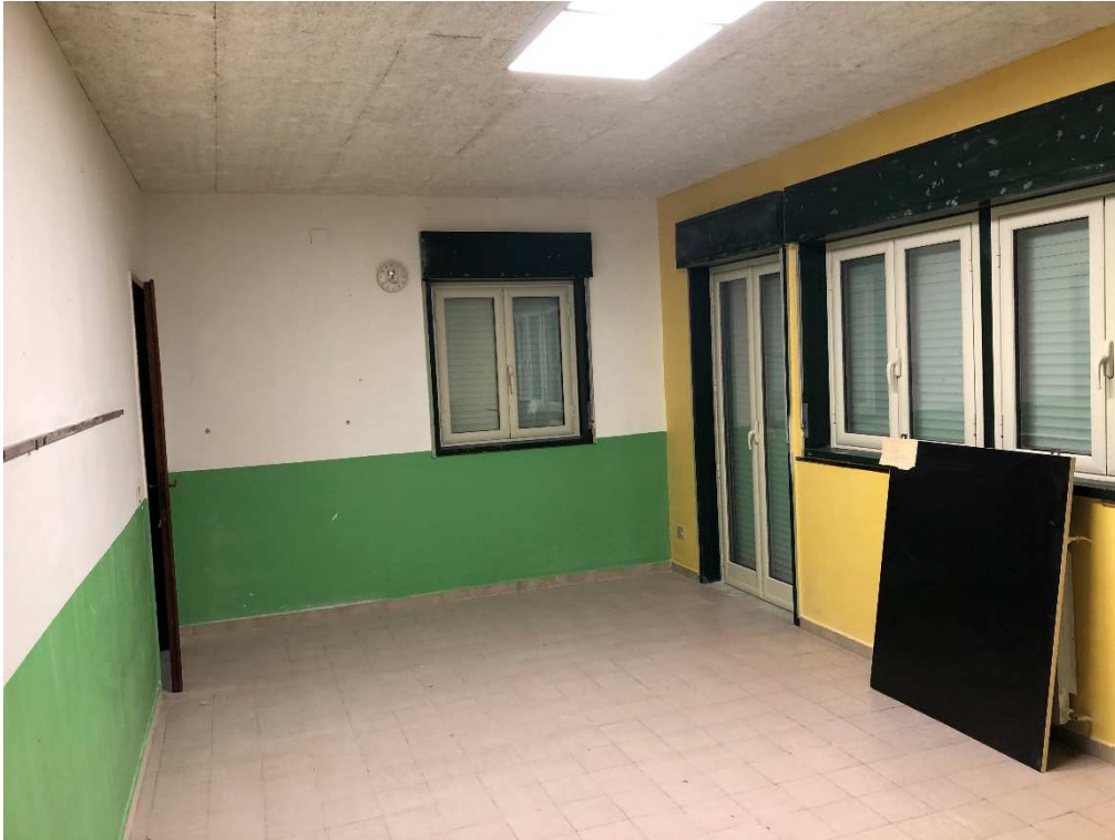
Figura 17 – Ripresa fotografica aula 3