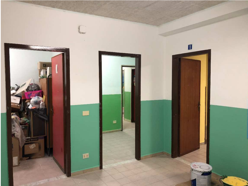
Figura 13 – Ripresa fotografica dell'ingresso