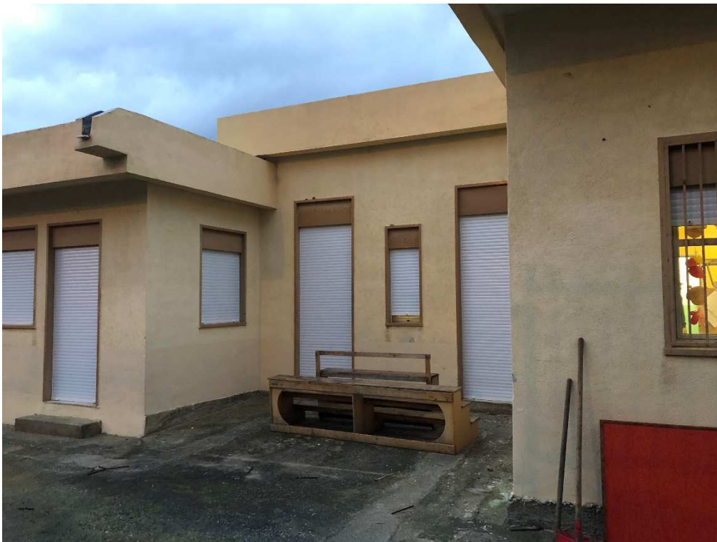
Figura 6 – Ripresa fotografica su porzione del prospetto SE