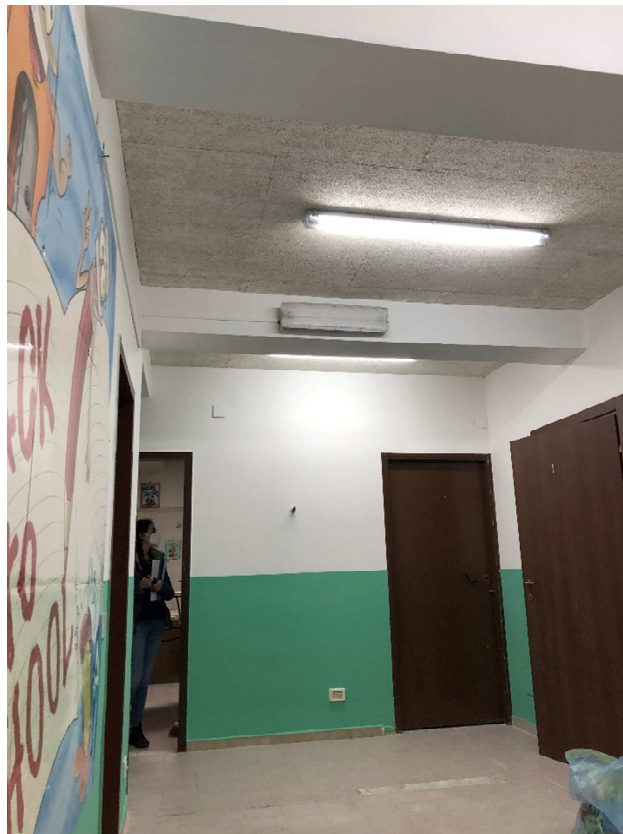
Figura 22 – Ripresa fotografica disimpegno 2