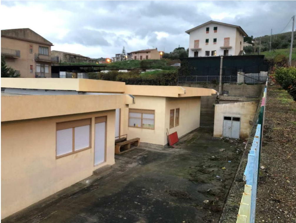
Figura 5 – Ripresa fotografica dalla via Placido di Blasi del prospetto SE della scuola materna