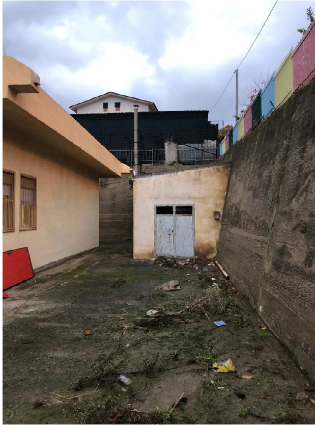
Figura 7 – Ripresa fotografica del deposito gasolio