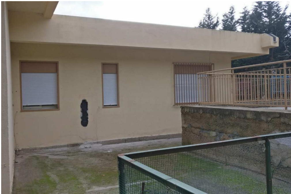
Figura 10 – Ripresa fotografica di porzione del prospetto NE