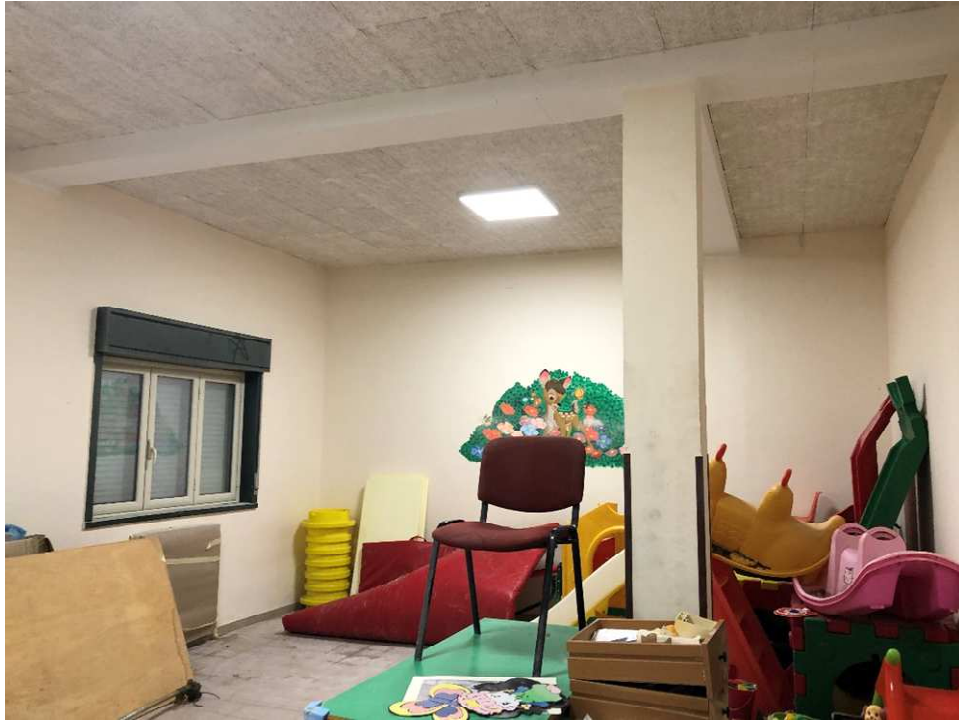
Figura 21 – Ripresa fotografica aula 6